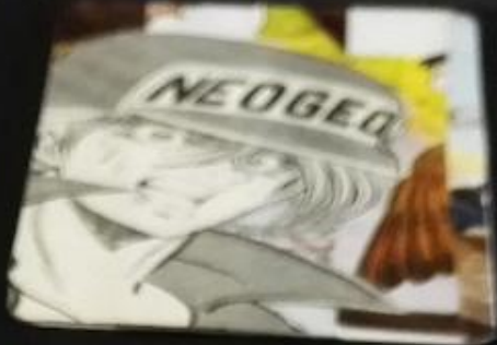
What is the word on the cap?