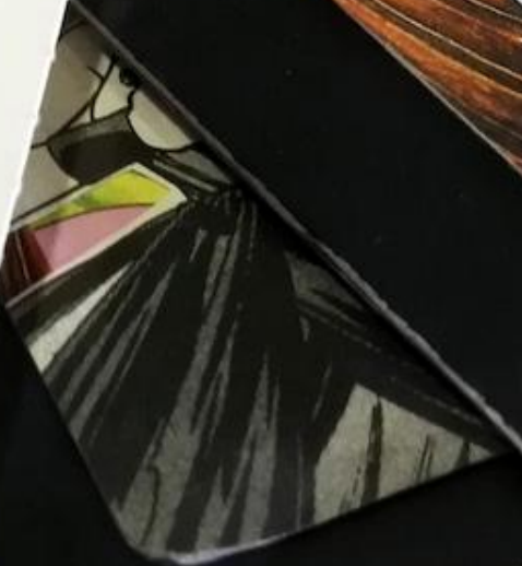
What do you think the w